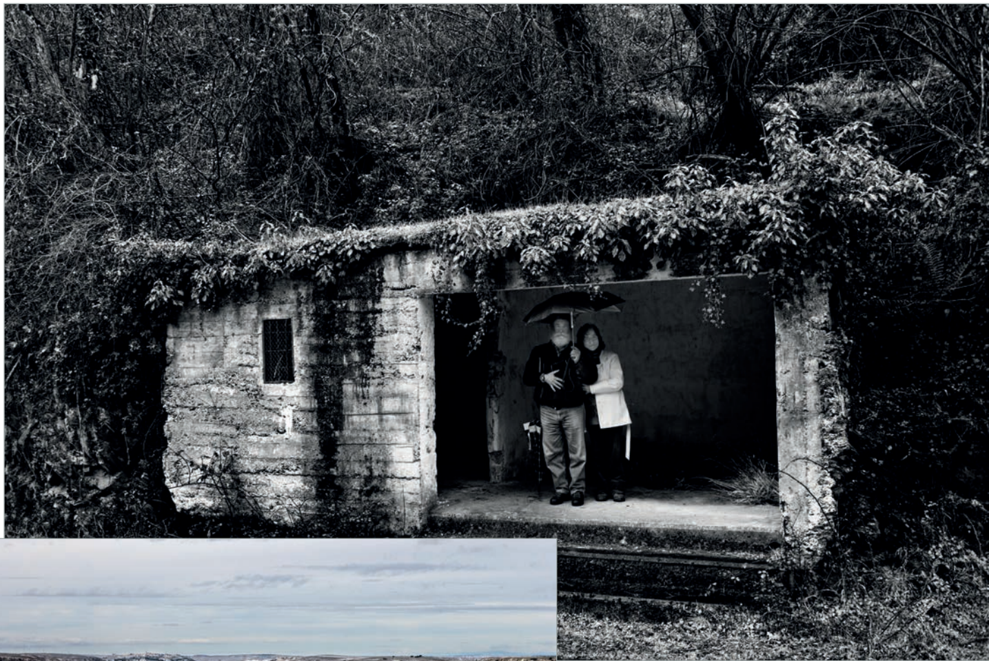
Foto de Luis en los Picos de Urbión: Amparo, su esposa, con Roberto Gómez.